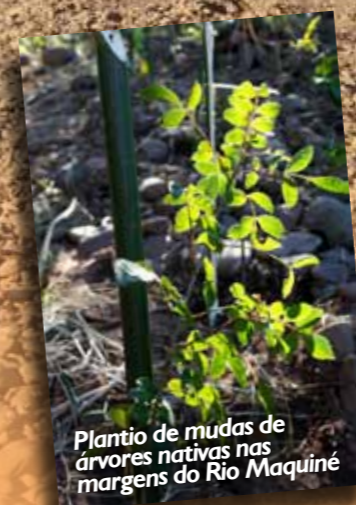
Plantio de mudas de árvores nativas nas margens do Rio Maquiné

Veja os cursos e eventos programados para o próximo trimestre