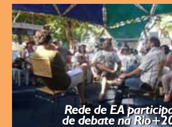
Rede de EA participa de debate na Rio+20